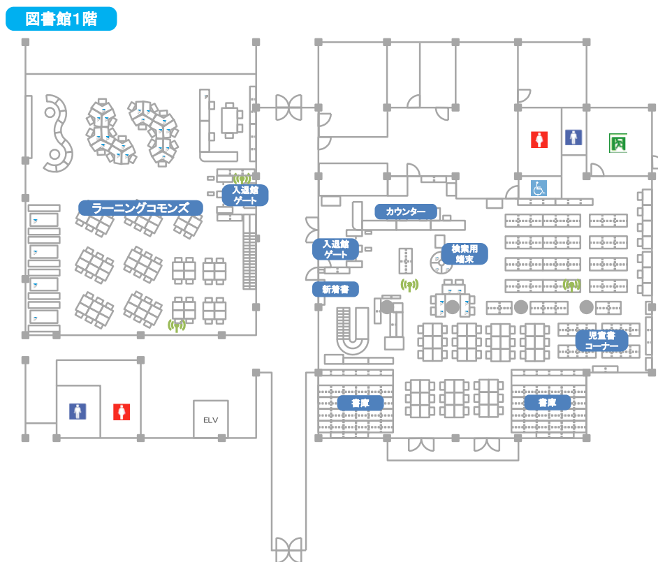
閲覧室 1F・ラーニングcommons平面図