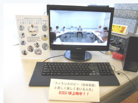
講座の様子をパソコンにて上映