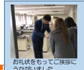
お礼状をもってご挨拶にうかがいました