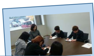
インタビュー結果を報告

1 年次Ⅱ期の必修科目で、日本語運用能力のさらなる向上を目標とする授業です。11 月の授業では、「聴く力」「話す力」を鍛えるために、昨年度に引き続き、学内の各部署に協力を得て、インタビューに挑戦しました。今年度は、ゼミごとにインタビュー内容について事前にしっかりと打ち合わせをしたうえで、協力していただく職員の方に、事前に依頼状をお届けし、実施後には報告書とお礼状の作成にビジネスの場で使われる書式に基づいてとりくみました。大学スタッフの方から、大学職員になったきっかけや今の仕事の内容などを直接伺ったことは、今後のキャリア形成においてもよい学びの機会となりました。