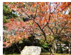
兵庫大学正門 付近の風景

兵庫大学のキャンパスもめっきり秋らしくなりました。Ⅱ期も半ばを過ぎ、学修活動も活発になっています。今回は、11月の学生の取り組みをご紹介します。