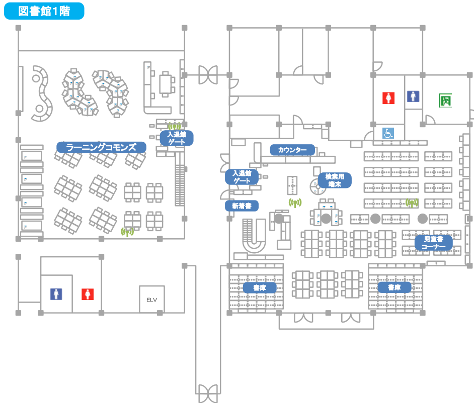
閲覧室 1F・ラーニングcommons平面図