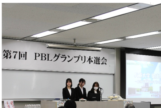
グランプリ 健康教室・健康教室カフェ