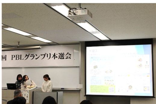
準グランプリ 2024 おはようクッキング