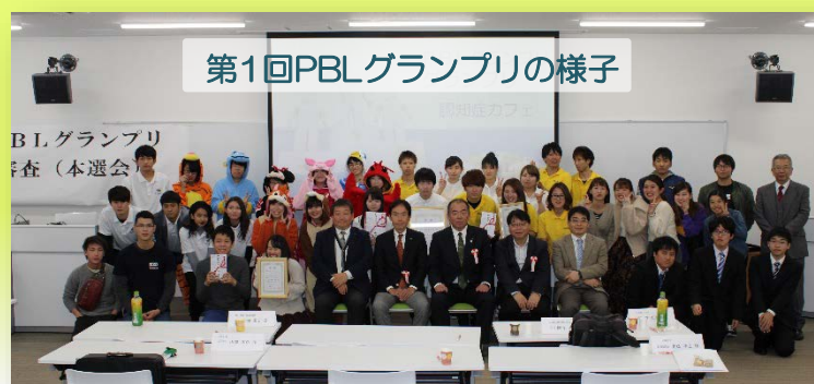
第1回PBLグランプリの様子